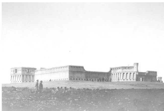
(E) Fuerte de Rostrogordo donde se hacían los fusilamientos.

“Siguiendo las Instrucciones del Estado de Guerra, el 17 de Julio de 1.936, cuando todavía en la Península la sublevación militar no pasaba de ser un lejano rumor, fueron asesinadas en las localidades del norte de África un total de 189 personas, por mantenerse fieles al Gobierno de España”.