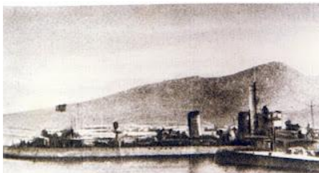
(D) “Almirante Valdés” embarrancado en el puerto

La aviación gubernamental el mismo 18 de julio, estando los barcos en puerto envió un avión que dejó caer unas bombas en la población vecina de Tauima ( donde estaba el cuartel del Tercio de extranjeros “La Legión” ) y otras en la Plaza, una de ellas impactó cerca de los cortados de Horcas Coloradas ( proximidades del polvorín ) y otra en el barranco de Cabrerizas Altas.