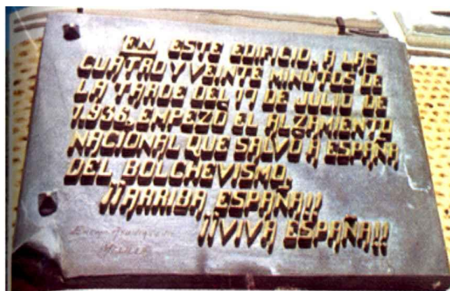
(A) Placa que estaba en el edificio