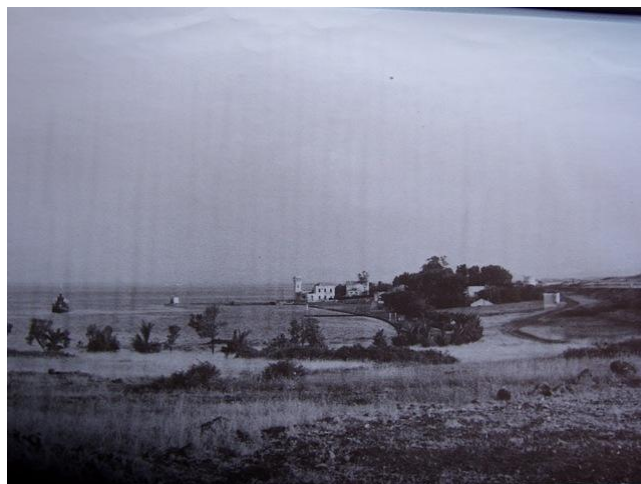
Donde estaba la Base de Atalayón

( D ) http://www.ceibm.org/alexca1100.html