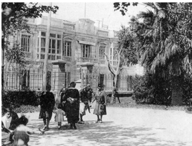
(B) Comandancia militar de Melilla