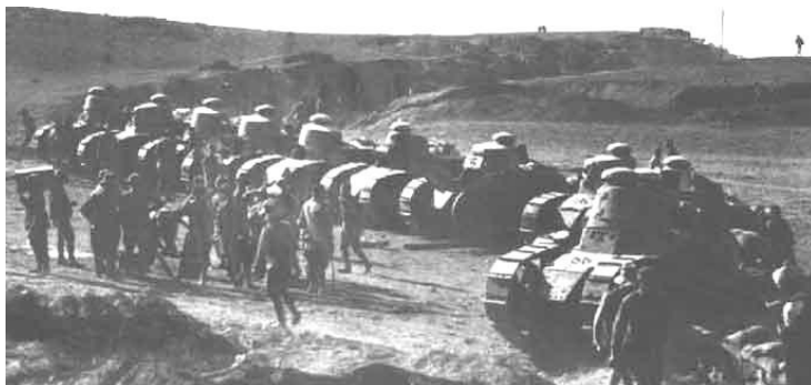
(A) Carros de combates blindados Renault FT modelo 1.917

Con un batallón de infantería de marina ( que desembarcó a las 24 horas ).Las fuerzas aéreas : la componía una escuadrilla de bombardeo: Farman Goliath de la ANF