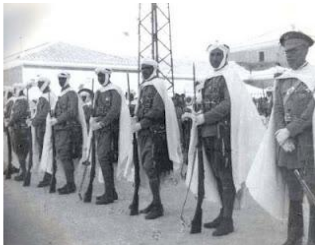
Fuerzas Regulares Indígenas de Melilla