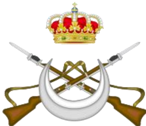
Emblema fuerzas regulares indígenas

Por esta acción le fue concedida la Cruz Laureada por O.C. del 01 de diciembre de 1.931 (D.O. nº 231 de 02 de diciembre de 1.931), siendo uno de los cinco españoles que se le ha concedido en dos ocasiones, la primera fue en el combate del bosque de Sidi-Dauetz apenas dos meses antes el 17 de julio de 1.925.