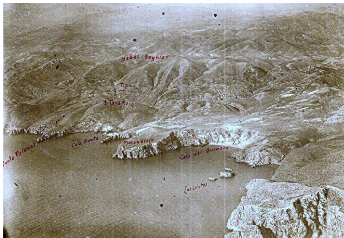
Bahía unos días antes

Previo al desembarco se efectuaron varios simulacros al objeto de adiestrar a las fuerzas y coordinar las acciones. Así, el día 3 de septiembre la columna de maniobra de Melilla realizó prácticas en la ensenada de la antigua ciudad de Casaza, situada en la parte occidental de la península de Tres Forcas. Esta columna había sido transportada en buques de la Compañía Trasmediterránea y estaba formada por fuerzas Indígenas y del Tercio.