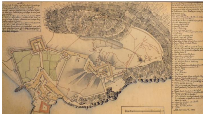
Plano de minas

Referente a los lugares denominados “Ataques”, eran pequeñas fortificaciones de piedra y de barro, situadas en torno a la Plaza: Ataque Seco, Ataque Alto, San Lorenzo, La puntilla, Río de Oro, La Horca, Huerta Grande, La leña, El Rojo, y Santiago . Todos ellos estaban situados en lo que en la actualidad es el Centro neurálgico de la ciudad, hoy día no existe ninguno.