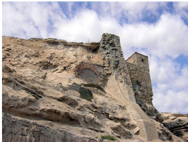
Resto del fuerte del Rosario.

E n principio el fuerte del Rosario estaba aislado del fuerte Victoria Grande y se comunicaba mediante un ramal subterráneo, más tarde se construyó un muro con aspilleras que los unían y después del asedio de 1.774-1.775 del sultán de Marruecos Muley Mohamed , ante la necesidad de reforzar las defensas de la ciudad, se transformó dicho muro en una batería. En este fuerte fueron abatidos muchos soldados y oficiales estando de guardia por franco tiradores guelayenses, así el día 22 de septiembre de 1.865 , al salir del fuerte, en la misma puerta, una traicionera descarga de fusilería, hace caer muerto al instante, a Tomás Gómez Guijarro , capitán de la 3ª compañía del batallón Disciplinario. En esta época gobernaba la Plaza el brigadier de infantería Bartolomé Benavides y Campuzano (1.864-1.866).