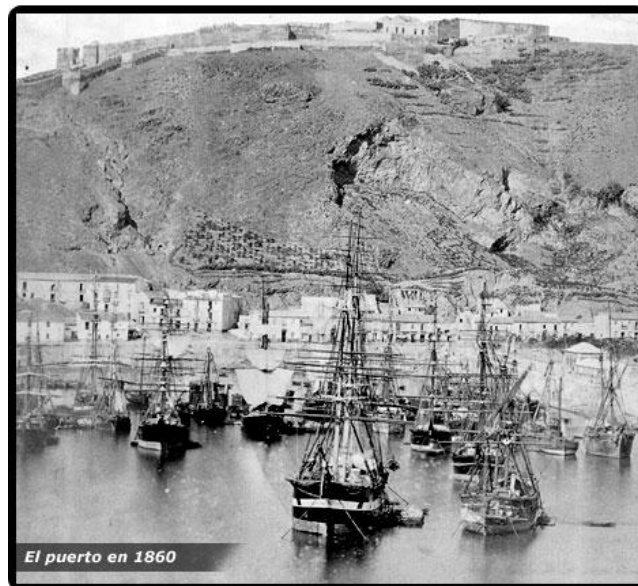
(A) Muelle de Málaga por aquellas fechas 1.860

En este mismo año y siendo gobernador Demetrio María de Benito y Hernández (1.839/47), los moros fronterizos queman las estacas del fuerte de Santa Bárbara ( situado en lo que actualmente es la Plaza de España, inmediaciones del actual Banco de España ).