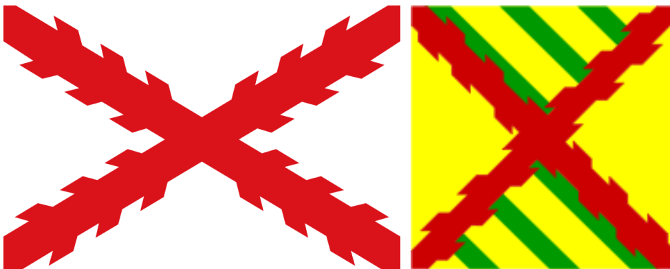
(A) Emblema y bandera de los tercio de infantería

El 2 de agosto de 1.702 salieron los soldados a combatir al campo y atacar una posición enemiga recibiendo varios balazos de los fronterizos, quedando en el campo tendido muerto Sebastián Soriano, mientras que Gabriel Barranco pudo refugiarse y ser atendido en el hospital donde falleció. Durante este año 1.702 el enemigo ejercía una presión férrea sobre la plaza, tanto que el maestre de campo Domingo de Canal y Soldevila (1.697-1.703) gobernador de la Plaza, tuvo que pedir refuerzos al monarca Felipe V, que a finales de año, envió una guarnición de refuerzo denominado “ Tercio de Cataluña ” tercio de infantería (A) ligera con su maestre de campo Blas de Trinchera al mando ( llegando a ser después gobernador de la plaza y tiene una calle con su nombre en el barrio del Polígono ).