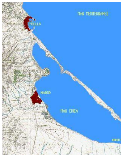
Mapa Mar Chica