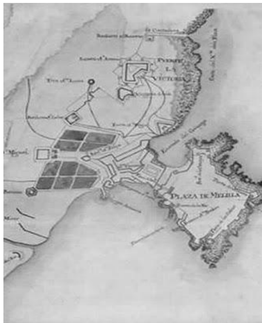
(A) Plano de aquellas fechas

http://ejercitosdeespana.blogspot.com/2010/10/el-sitio-de-melilla-de-1774-75.html