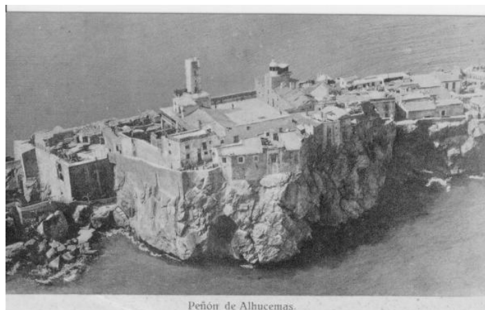
Peñón de Alhucemas