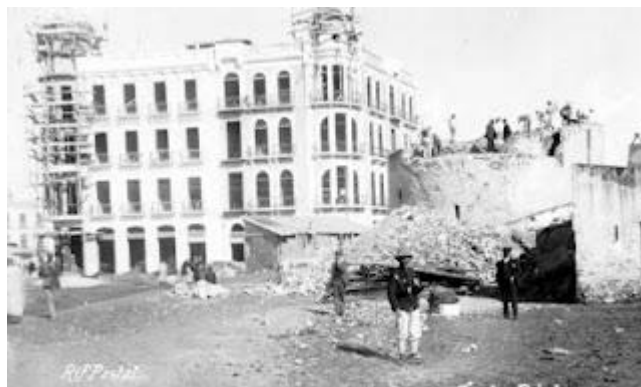
(A) Desmantelamiento de la torre de Santa Bárbara