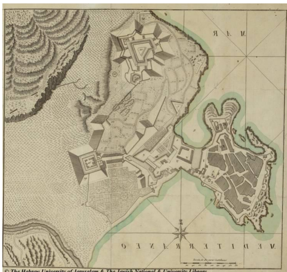
En el triángulo esta del Cubo