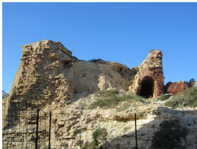
Lo que queda de la retaguardia del fuerte.

En este año y me estaba previsto las obras de desviación del río de Oro, pero se llevó a cabo a final de año esperando a que S.M. el Rey de Marruecos enviará a la frontera de Melilla, un cuerpo de tropas al mando de un Alcaide enérgico, para que evitar que los fronterizos puedan molestar a los trabajadores españoles.