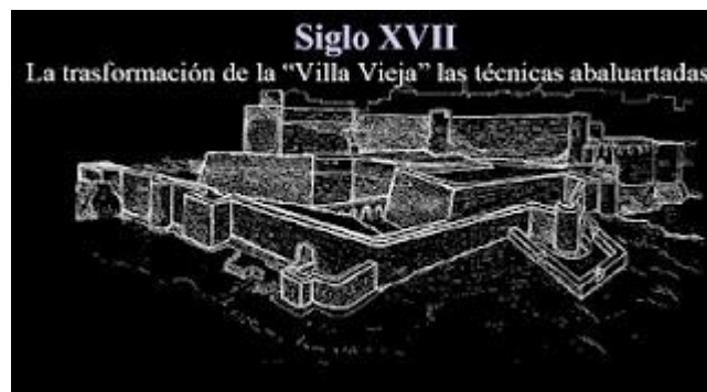
En estos años se empieza la técnica abaluartada.