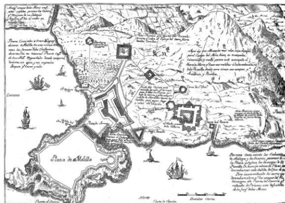
Plano de 1.775

En el año 1.779 los moros habían emplazado "ataques" (especie de trincheras) a la izquierda de la desembocadura del río de Oro, en lo que hoy se llama Paseo del General Macías (Muro X), para descubrirlo y poder combatirlo, el 3 de julio de 1.779 con ocasión de una salida de reconocimiento, embarcaron algunos soldados en una lancha capitaneada por Miguel Zazo, para destruir uno de los "ataques", los fronterizos observaban la salida, y cuando tuvieron la embarcación al alcance de nuevos parapetos escondidos entre cañaverales, hicieron una descarga sobre ella, un certero disparo en la frente de Miguel Zazo le ocasiono la muerte en acto. Así acabó su vida uno de los más bravos oficiales, que tanto se habían distinguido durante el sitio por su valor y arrogancia.