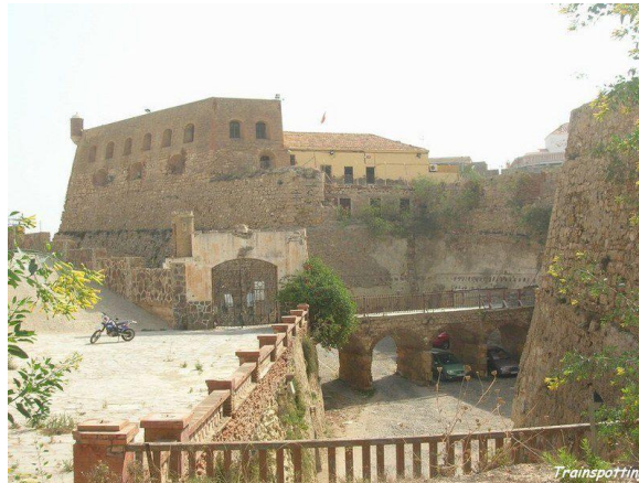
Foso del Hornabeque