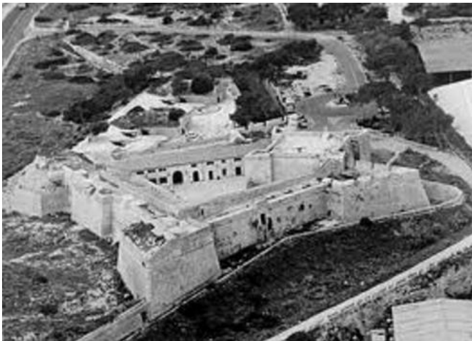
Fuerte de San Carlos construido sobre 1.764