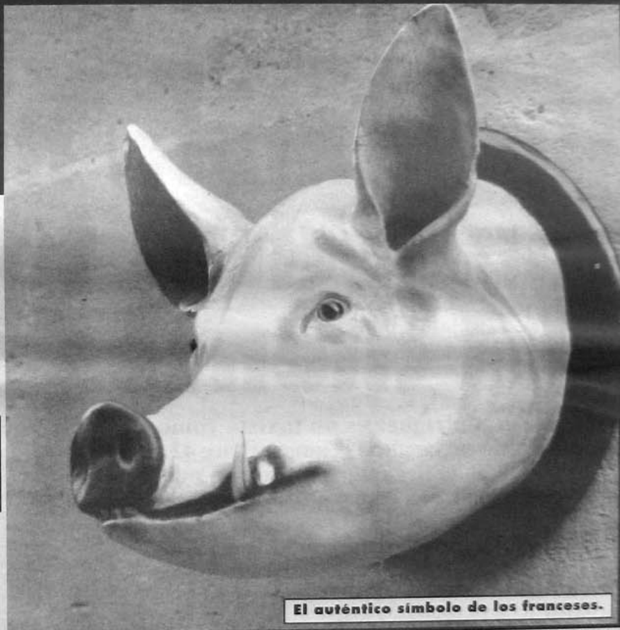
El auténtico símbolo de los franceses.

Aún hoy en día, muchos franceses siguen sin reconocer al gallo como su símbolo y llevan con orgullo cabezas de cerdo prendidas en la solapa. El marrano es su históricamente su emblema.