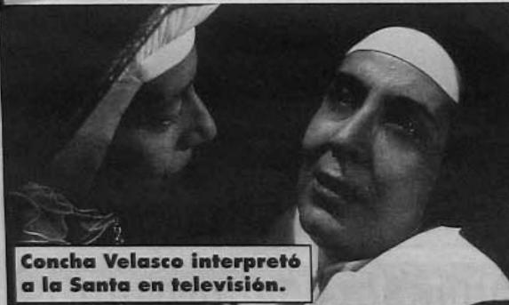
Concha Velasco interpretó a la Santa en televisión.

Después, el informe cayó en manos de la CIA, quien aconsejó a George Bush que retirara las obras de la Santa de todas las librerías.